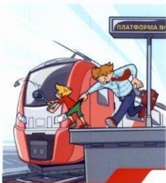
Железная дорога – не место для игр!